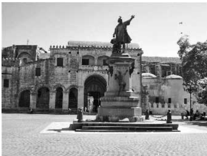
“Catedral Metropolitana Santa María de La Encarnación, Primada de América”. És el principal monument de la capital dominicana, es troba en el Parc Colom, enfront del Monument a Cristòfor Colom. És l'església més antiga del Nou Món. La primera pedra va ser col·locada el 1510 per Diego Colom (fill de l'Almirall).

També podríem relacionar-lo amb Joan Xo de Gamboa, que fou armat cavaller per la reina Joana i anomenat noble capità general pel comte d'Empúries, el 4 de gener de 1467, en plena guerra civil de la Generalitat de Catalunya contra Joan II. Aquestes gestes foren destacades pel secretari de la Reina, en Bartomeu Serena. 2