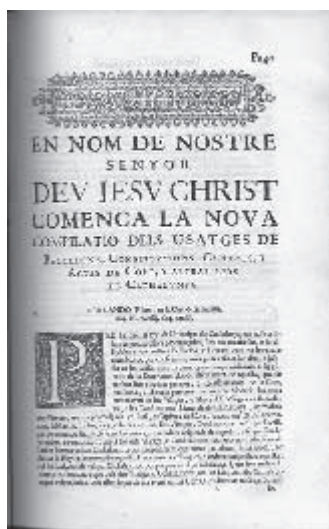
Llibre dels Usatges