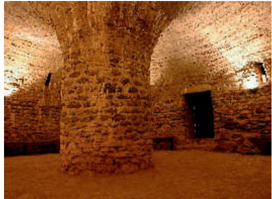
Sant Miquel de Cuixà, cripta

Se'm fa evident que un poder fàctic està descatalanitzant i adulterant el patrimoni arquitectònic català i tergiversant l'obra d'Antoni Gaudí.