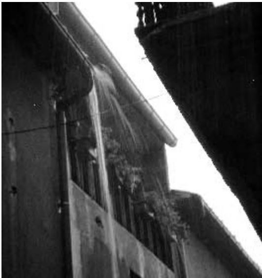
Raig de canals