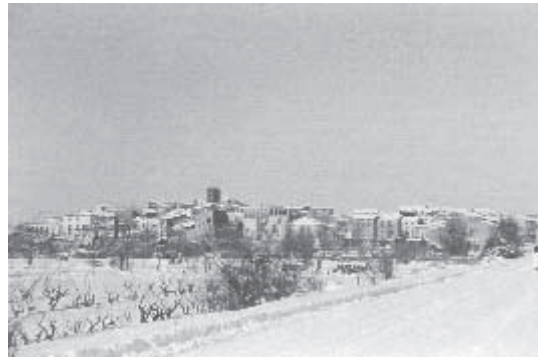
Tarroja nevada, any 1962

Ens tracta molt malament l'aigua del cel. "Al meu país no sap ploure", canta en Raimon, referint-se a la se-