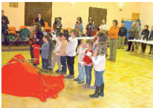
Sala de la vila. Tots a punt per fer cagar el tió.2010

de llenya per alimentar la llar de foc. Els regals que el tió cagava no eren ni joguines ni llaminadures, eren l'escalfor i la llum que proporcionava a cada família que es trobava reunida a la vora de la llar de foc.