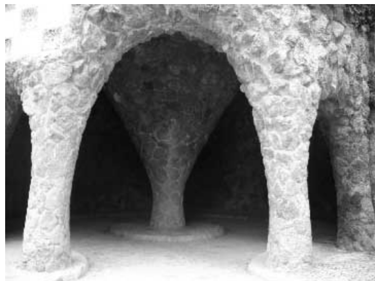
Cripta del parc Güell

Vaig fer investigacions i una de les persones a qui vaig fer la consulta va dir-me que aquella construcció era un "elefant".