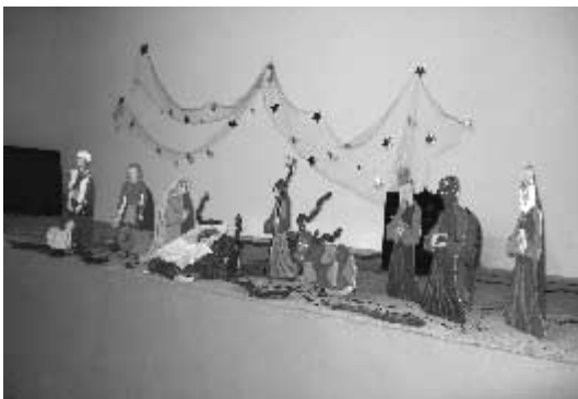
Pessebre artesà a la sala de la vila

F. Pascual Greoles del seu llibre Soca d'olivera