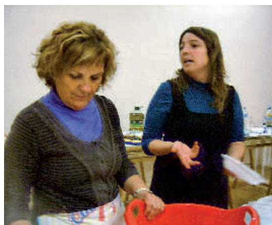
Catalina i Xisca en plena feina de cuineres

Els participants van ser una vintena, només el primer dia, i va ser tot un èxit. L’afluència de tarrogencs aliens al curs va voler treure el nas a la cuina per així satisfer la seva curiositat. Tots van ser invitats a fer un petit tast.