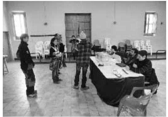
Votants a la sala de la vila