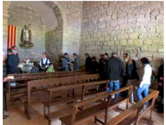
Recollint la coca dins l'ermita

Aquest any, la comissió "d'Estudis Tarrogencs" va decidir eliminar de la festa de Sant Julià, la mona que feia uns anys es rifava entre els assistents. A canvi, ja que dos dies abans a Catalunya es celebrà la festivitat de Sant Jordi, dia de la rosa i el