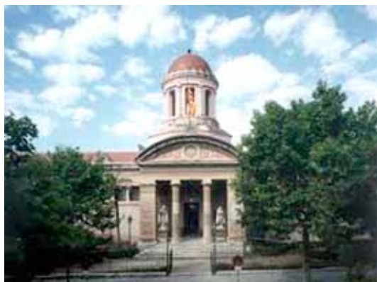
Exterior de la Biblioteca-Museu Víctor Balaguer de Vilanova i la Geltrú