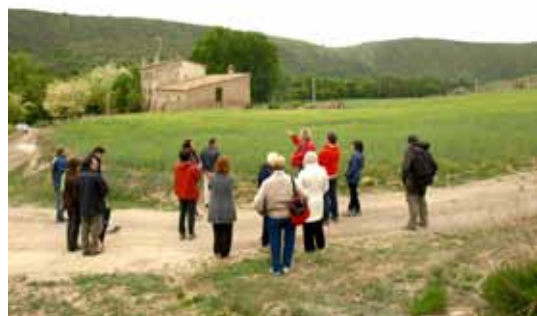
El mateix grup de participants experts, en un indret del Llobregós

incontrolats de terres que han accentuat l'erosió en alguns espais del PEIN Llobregós. A més, varen triar els miradors de Talteüll i de l'Aguda per identificar les agressions que suposen l'avenç desordenat dels aerogeneradors, la fragmentació del paisatge causada pel desgavell urbanístic en