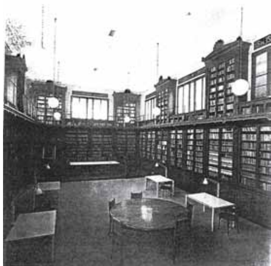
Interior de la Biblioteca