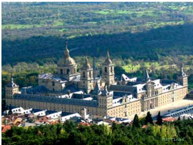
Monasterio del Escorial - Madrid

entre els monarques i l'almirall, signades a Barcelona entre l'1 de juliol i el 5 de setembre de l'any 1493. O bé per d'altres documents de Cancelleria Reial o de cèdules relatives als preparatius del segon viatge des de les costes de la ciutat comtal. 6