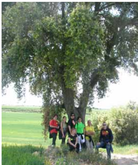
Grup d'excursionistes sota l'ombra de l'alzinera del pla de Mejà

• El primer diumenge de maig, Tarroja va celebrar la festa del Roser. Dissabte dia 31, els caminadors tarrogencs es van posar en marxa per fer la 3a caminada popular, uns 14 Kms "Tarroja va als Castells".