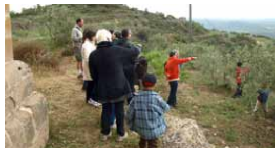
Grup de participants experts

Torà (JM).- El passat dissabte 7 de maig, el Fòrum l'Espitllera va organitzar la segona sortida per identificar, analitzar i debatre el paisatge de la Segarra. Aquest cop, el recorregut es va centrar en el territori que creua el riu Llobregós, travessant Guissona, Massoteres, Biosca i Torà. Els participants de la sortida, que va reunir historiadors, arqueòlegs, economistes, juristes, experts en turisme, mediambientalistes i enginyers, entre d'altres, varen aturar-se en una