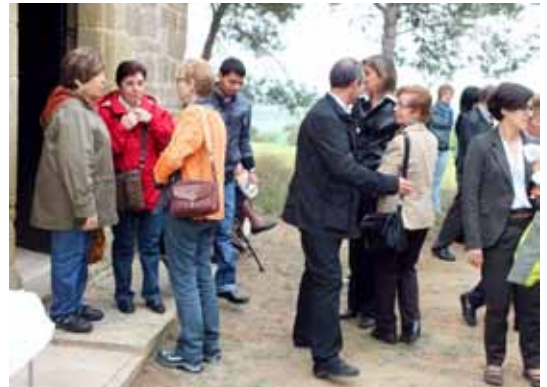
Els assistents fan tertúlia a la placeta