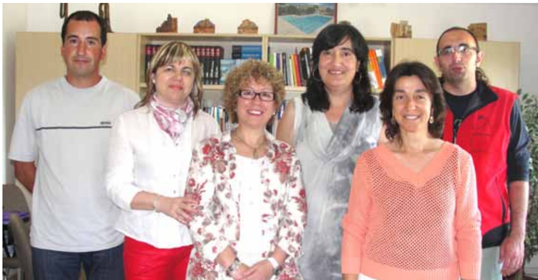
El govern municipal de la vila de Tarroja, recentment elegit, amb la secretària

Segurament que tots volem un govern més fort, un projecte més sòlid, amb una millor economia, amb més feina per a tots i amb un ideari que defensi la catalanitat. Votant haurem pogut dir el que volem i ara convé que tots hi col·laborem per fer-ho possible.