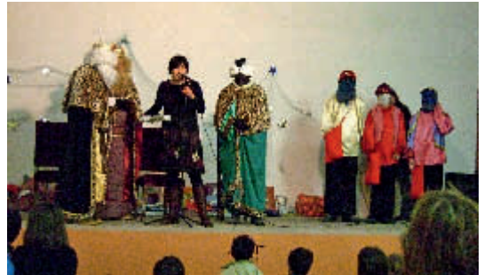
L'alcalde de la vila dona la benvinguda als Mags

Ses Majestats aquest any van canviar el trajecte d'arribada i van fer l'entrada a Tarroja, amb primera aturada a la plaça Nova.