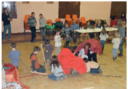
Els petits espectants, davant el tió

Tot i que l'Ajuntament fa esforços perquè la festa tingui una bona participació i tots els vilatans en puguem gaudir, hem trobat a faltar algunes famílies, que segurament per motius força excusables, en una nit tan