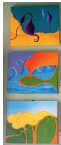
Detall de l’exposició de pintures al Cafè-Bar de Tarroja