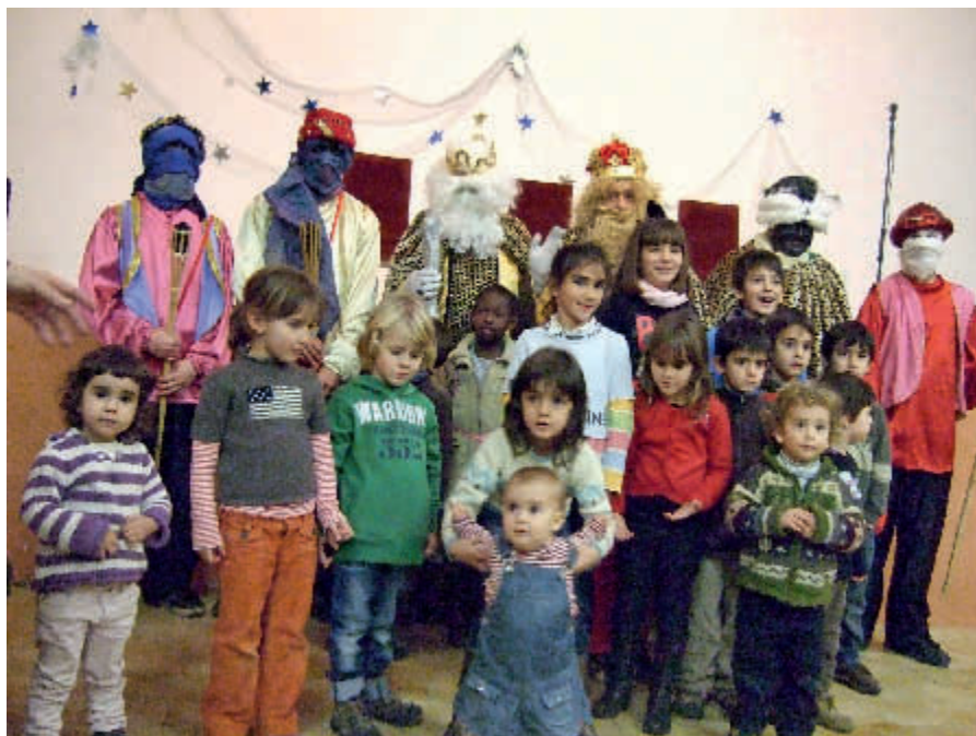
Grup de nens i nenes de Tarroja amb els Reis Mags

La festa va continuar per als grans, fins entrada la mitja nit. Els petits s'havien ja retirat, per posar les sabates al balcó, el menjar, l'aigua, pet als camells dels Reis. Tot i què també hi van mancar alguns tarrogencs, la festa va ser molt concorreguda i força animada.