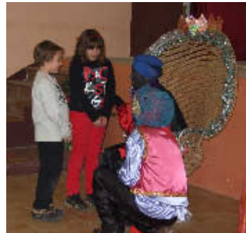
L'Estel i l'Albert parlant amb el patge Karham i el seu assistent

• La “Vetlla de Nadal” a la parròquia, com és costum, es va celebrar la Missa del Gall, una mica aviat, a les 8 del vespre, per decisió dels assistents. Després de la celebració va haver-hi temps per sopar en