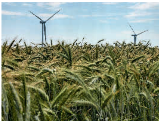
Sector primari. Implementació de noves tecnologies

La seva opinió ha de tenir una incidència substancial en el procés de concessió de les autoritzacions per part de les autoritats competents. Cal tenir molt en compte les persones, la seva opinió envers la possible construcció d'una instal·lació i la implicació que l'activitat té en elles.