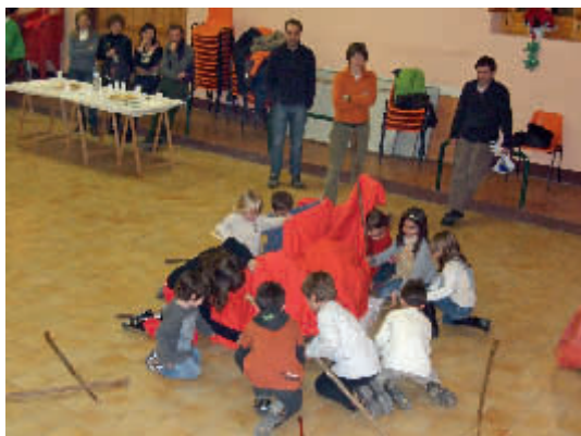
Tots volen recollir el regal del caga tió

assenyalada com aquesta, no vam poder desitjar-nos mútuament el “Bon Nadal”.