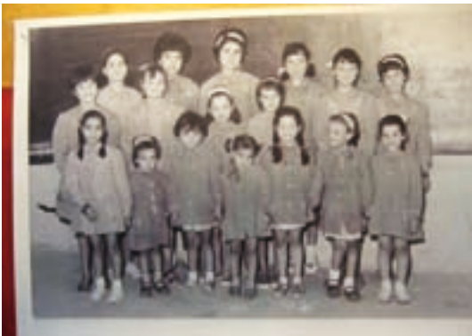
Alumnes de l'escola de nenes

però tots amb la intencionalitat de distreure's i de fer-ho passar bé als assistents.