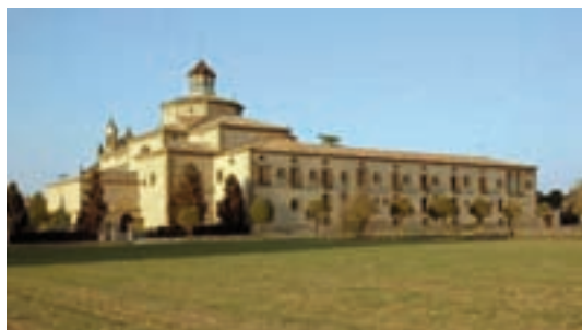
Monestir de Sant Ramon

Els boscos d'alzines, roures i garrics envoltaven aquests llocs