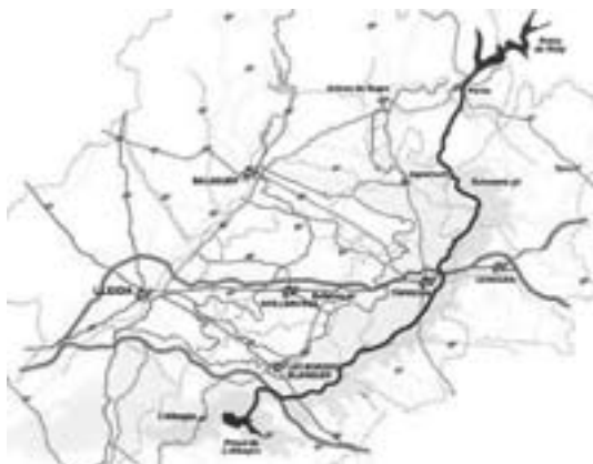
Mapa del recorregut del canal

Pretendre obligar, per nassos, que es reservin 40.000 Ha. (40.000 mançanes de l'eixample barceloní o 61.538 camps de futbol de 100x65) per als ocellets esteparis, és una intenció es-