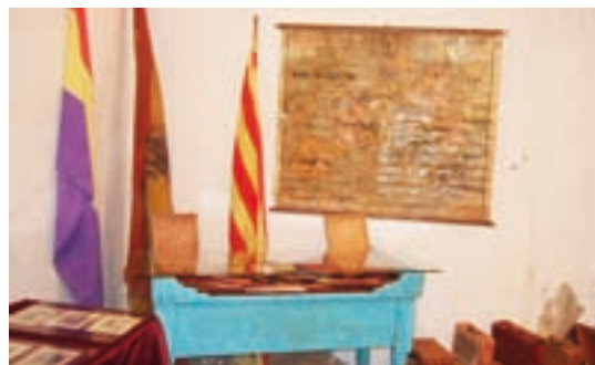
Tres èpoques diferents, tres banderes...