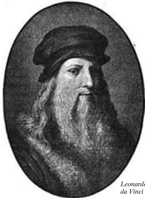
Leonardo da Vinci

les seves aptituds musicals 1 . Aquí el veiem amb un deixeble seu, Atalante Migliorotti, a qui "al 1493 Isabel li encarregà que li fes una guitarra" 2 .