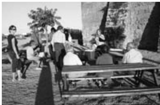
Berenar abans d'emprendre la tornada, a l'ermita de Sant Vicents de Ratera