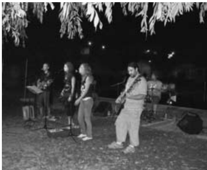
Concert a l'espai de la piscina

• Divendres dia 7 d'agost, es va programar la pel·lícula "La Ola", que per dificultats tècniques no va ser possible passar, però el programa va quedar suficientment complet, amb el documental "Alerta Torà", el qual va servir per informar a uns, i com a motiu de reflexió a altres, sobre els fets