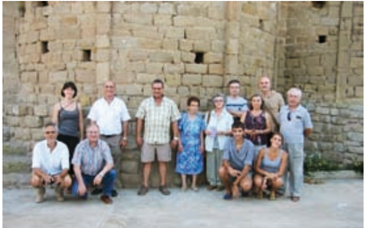
Grup de participants al cursset d'Arquitectura Popular

L'elaboració de la pedra és un procés mil·lenari i la configuració d'aquesta matèria