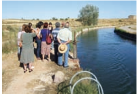
Membres del grup contemplant el canal