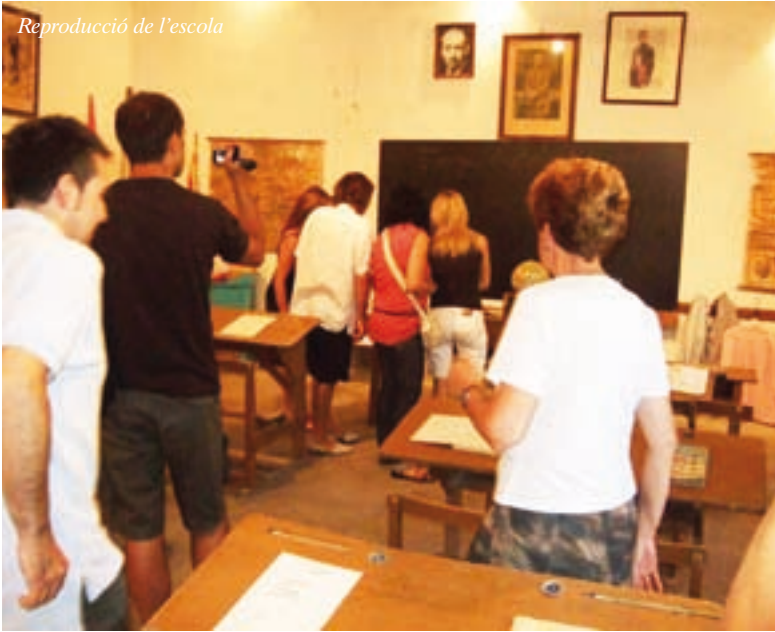
Reproducció de l'escola

Dissabte a la tarda, Cercavila amb el Bestiari Carranquer i el drac Aimeric de Sant Antolí.