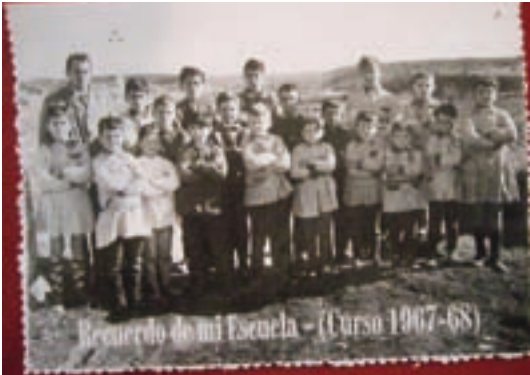
Nens, alumnes del curs 1967-1968

• Els mesos d'estiu sempre són avinents, per programar petites sortides culturals i actes a la fresca, alguns a la terrasseta de la piscina, altres a la sala de la vila,