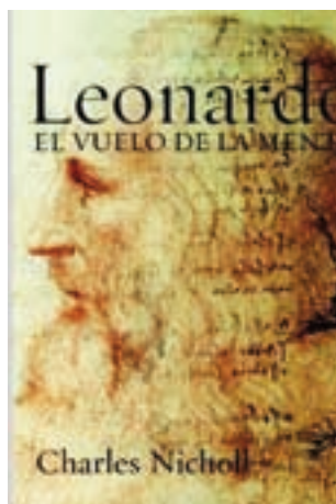
Charles Nicholl, autor

marquès de Gerace, fill il·legítim de Ferran I de Nàpols 19 . I, per tant, va ser nebot dels reis Alfons II i Frederic II, i cosí, alhora de Ferran II, dit Ferrantino 20 . El Cardenal Lluís havia aspirat al solí pontifici, després de la mort de Juli II, al 1513. I, “encara que les