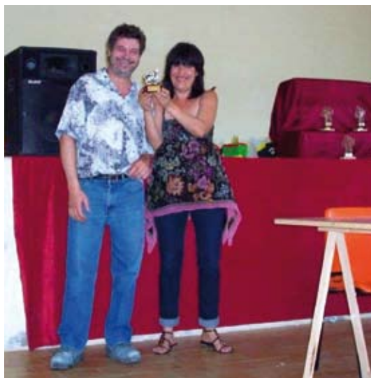
Millor jugador local.