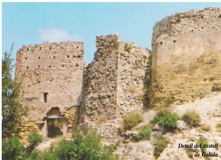
Detall del castell de Gelida

Llavors també tindria una explicació plausible que aquests personatges principals,