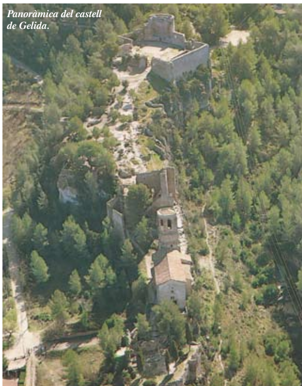
Panoràmica del castell de Gelida.