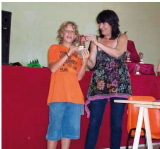
Segon classificat categoria C.

• El diumenge dia 27 de juliol va tenir lloc el primer campionat d'escacs de partides