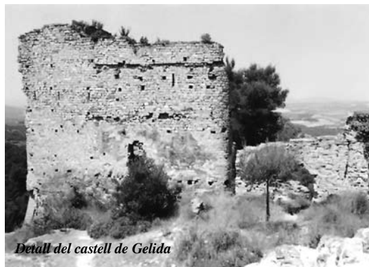
Detall del castell de Gelida

Seria, doncs, també congruent que participés –juntament amb els seus parents Bertran–, en els primers viatges transoceànics.