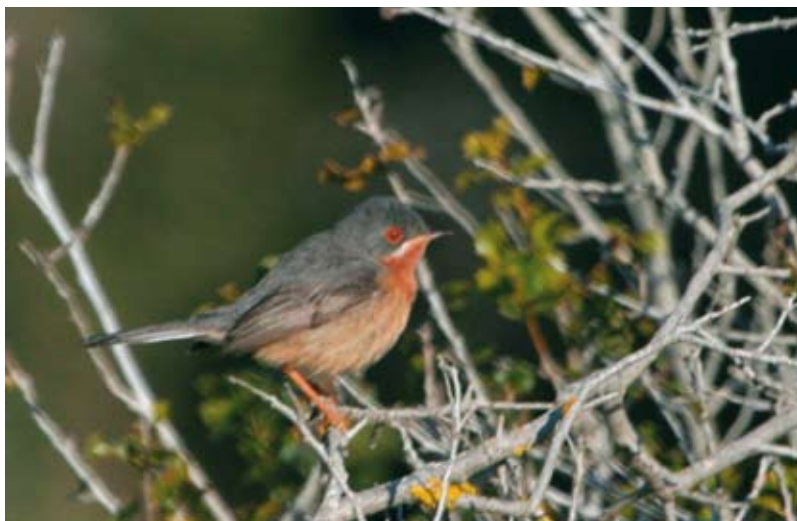
Tallarol de garriga