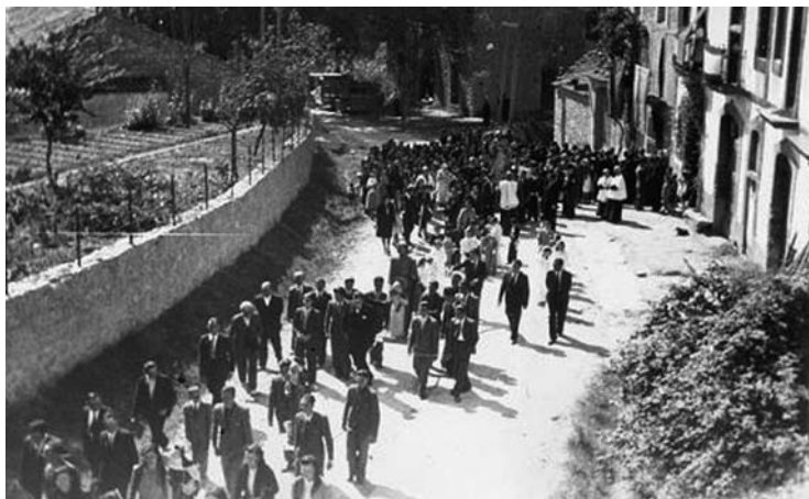
Processó de la Festa Major

respecta al Sindicato Fomento Agrícola, en el mismo no existe espectáculo público de clase alguna, pues el baile que se celebra los días festivos, escuetamente es para el Sindicato, quien se halla acogido a los beneficios que le conceden las disposiciones vigentes, pero a pesar de ello, se permite esta Alcaldía en