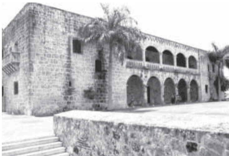
Casa de Colom a Santo Domingo