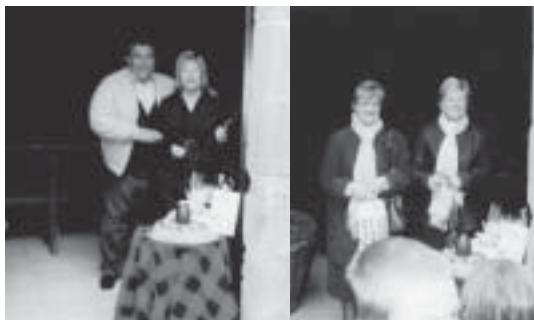
Majorales de Sant Julià