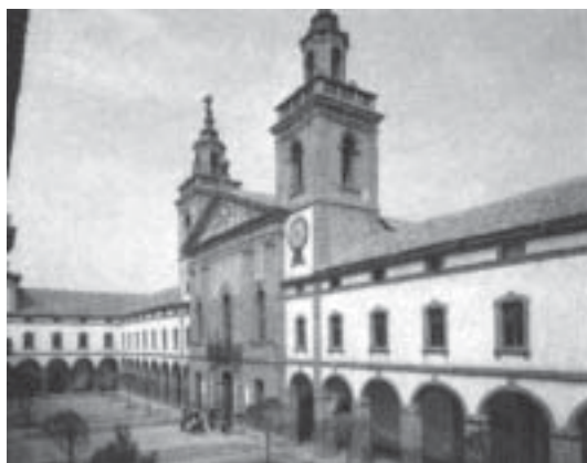
Universitat de Cervera