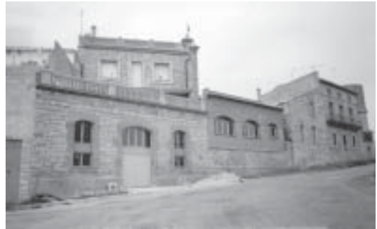
La casa de cal Camps, avui renovada.