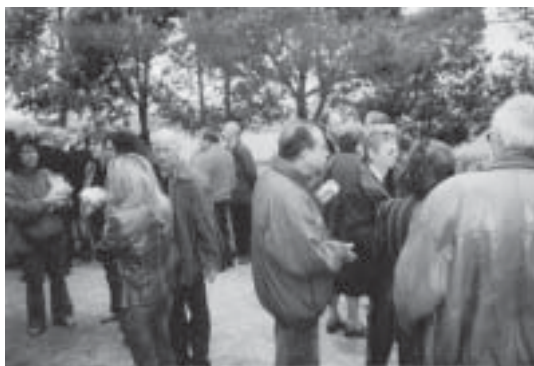
Instantànies de l'aplec

Hem trobat a faltar vilatans de la tercera