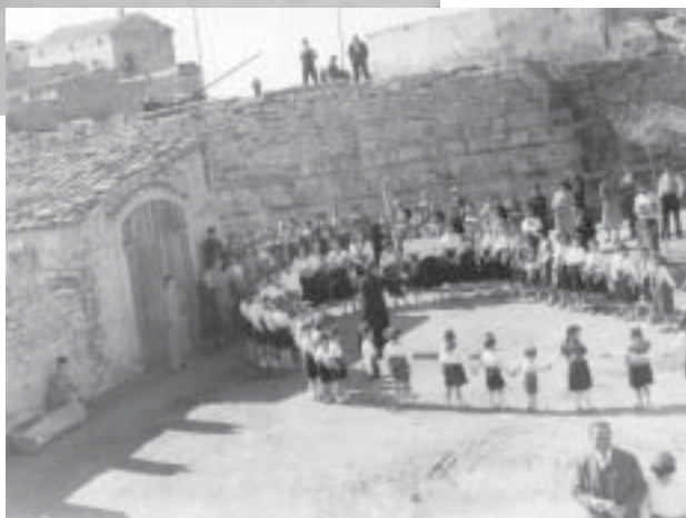
Cantada de caramelles a l'era del molí

La nostra vila de Tarroja també ha patit aquesta emigració i tots, qui més qui menys, enyorem ben segur aquells anys plentítics quan hi havia un nombre important d' infants i de joves que impregnaven d'ambient cada llar i les places i carrers.