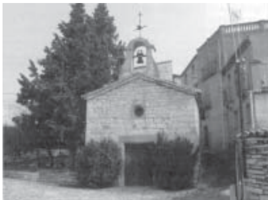
Capella de Sant Ramon Nonat a Portell