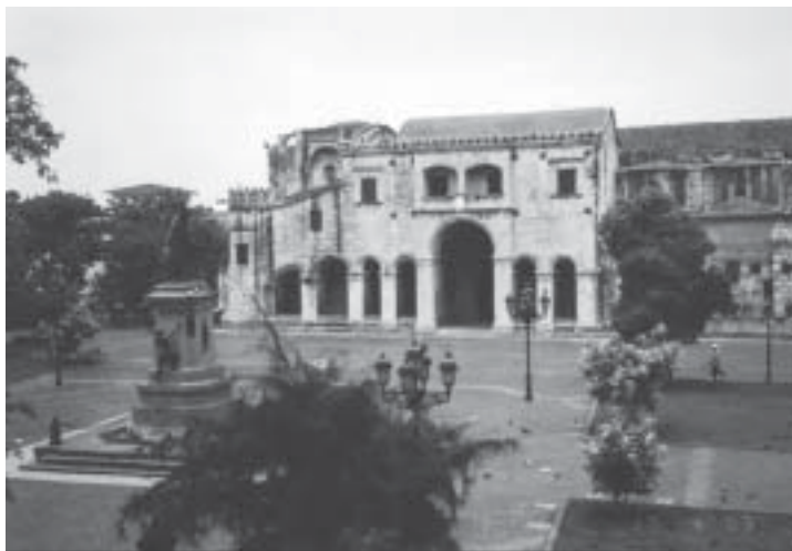
Parc de Colom a Santo Domingo

perador Carles V, i va passar molt temps lluny de la seva gent fins que va morir. La virreina va haver de deixar el seu hereu per venir a reivindicar els drets pactats amb la corona als tribunals peninsulars durant vint anys. Ocasíó que va aprofitar per casar la seva Isabel amb Jordi Albert de Portugal, comte de Gelves; Cambrer Major de Carles I de Bragança; a Joana amb Lluís de la Cueva, germà del duc d'Alburquerque i capità de la guàrdia imperial; a Maria, amb Sanç de Cardona, Almirall d'Aragó; a Cristòfol amb Anna de Pràvia; a Diego se li va concedir ser el patge del príncep Felip a més de l'hàbit de l'ordre de Santiago; i a Felipa ser ingressada com a religiosa en un monestir, on va morir el 1548.