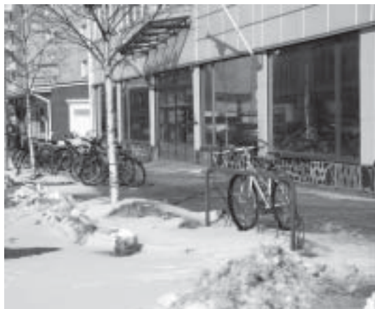
Un carrer de Kemi (Finlàndia).

● Aprofitant la Setmana Santa, un grup de la nostra vila, amb l'ànim de trobar-se amb l'Ignasi Artigas i recórrer una mica de món, han volat a Finlàndia, el país dels llacs, i han pogut adonar-se que és ben diferent, amb una cultura que sorprèn i sobretot amb un clima atmosfèric que, a mesura que van passant els dies, va aclaparant el caràcter dels qui, acostumats al sol i sobretot