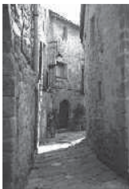
Carrer de Florejacs

Segons diu la llegenda, la dama, en veure que el sistema funcionava bé, va posar en pràctica diverses vegades tan dràstica manera de traure's del davant els amants que li feien nosa. Tant s'hi va afecci-