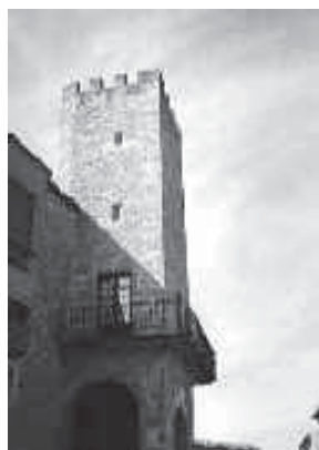
Castell de Florejacs

onar que al final, les seves tràfiques d'amor i de crims van arribar a oïdes del rei. Com que eren temps en què les coses anaven com anaven, el rei va enviar mis-