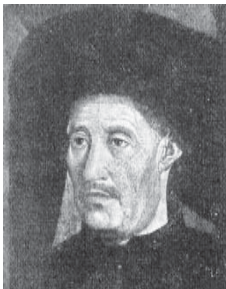
Enric el Navegant

-Any 1487. Expedició de Bartolomé Dias a l'extrem sud d'Àfrica (descobrimient del cap de Bona Esperança). Se-