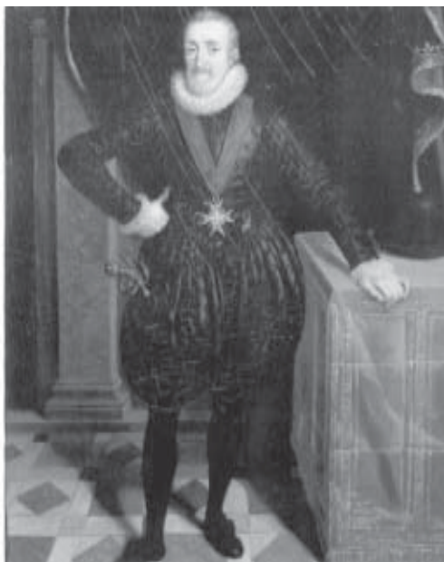
Enric IV d'Anglaterra

-Quina relació mantingué en Colom amb aquells portuguesos que participa-