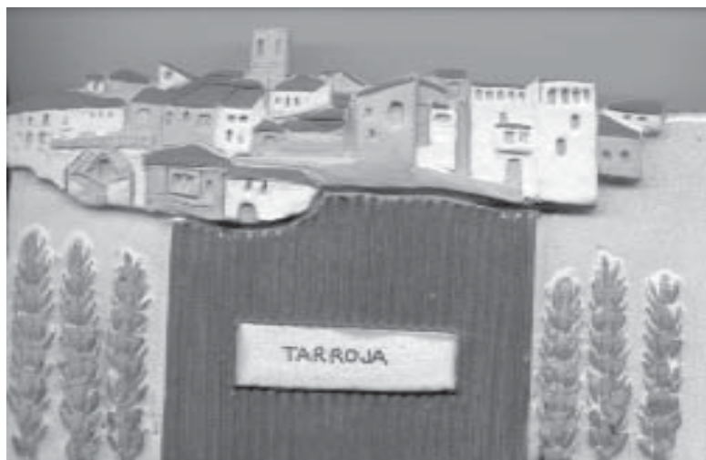
Ceràmica de Sisco Sociats

Terra Rubra com a posseïdors del símbol que ell va dissenyar i que des del primer dia lluïm orgullosos en l'encapçalament de la nostra revista, volem rendir-li homenatge i perpetuar-lo en el temps.