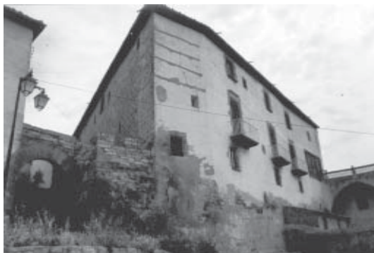
Cal Capell, avui cal Sileta

Vuy als 14 de febrer de 1792, se ha soltat del contra escrit depòsit la summa y quantitat de sis-centas lliuras (dihem 600 lliuras) a favor de Isabel Montull y Tella per contemplació del matrimoni que als 20 de febrer de 1791 contractà ab Anton Montull, pagès, del lloch de Soses, bisbat de Lleyda, com de sos desposoris ne fa fee lo reverent doctor Miquel Garriga, prebere y rector de Tarroja, als 8 de mars de 1791. Qual partida de sis-centas lliuras ha soltats lo senyor