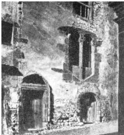
Casa de Colom a Funchal (Portugal)

Si qualche cosa adopta versemblança és la seva ascendència reial i portuguesa. Precisament, Felipa és filla de Pere de Portugal, duc de Coïmbra, fill del rei Joan I d’Avis i, d’Isabel d’Urgell, filla del comte d’Urgell. Per tant, el casament (1428) va suposar l’enllaç de dues cases reials d’ampla tradició. Un parentat que manifesta la salut de l’estirp catalana. Ara bé, el matrimoni ací a ressaltar és el de Colom i Felipa. Per la cronologia, tot fa pensar que no pot ésser el Colombo genovès (massa jove), sinó el Colom català (nascut - probablement - el 1424 i mort el 1506). Un altre reforçament de les noces del navegant amb Felipa és la informació aportada per Gonzalo Fernández de Oviedo. Aquest fa coincidir el citat Perestrello amb el llinatge propi de Colom. Síntoma inequívoc que hi ha comunitat de pàtria. Tot això, també ens duu a pensar que Colom no és pas