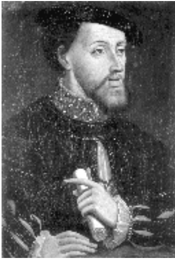
L'Emperador Carles V

només parlen de la segona varietat, i gens de la primera.