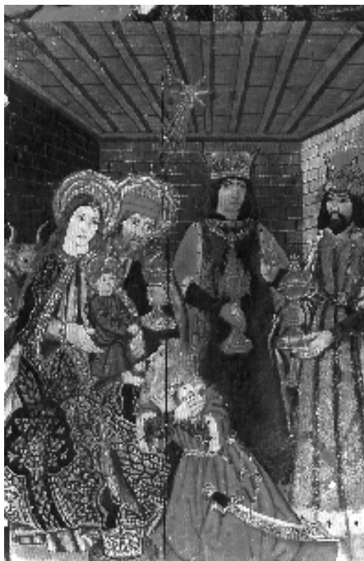
Retaula d'Ivorra, s. XV (Museu Diocesà i Comarcal de Solsona)

Recuperem el Nadal perquè esdevinguem nous o renovats per encetar camins d'esperança en el diàleg sincer i en la tolerància.