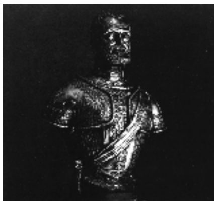
Bust de Carles I

Així mateix, a la capital catalana també van arribar en aquells dies “els tres pares de Sant Jeroni d’aquests illa Espanyola, volent besar les mans al rei i fer-li relació de com quedava la terra”; 84 cosa que no va ser possible perquè l’Emperador ja se’n anava.