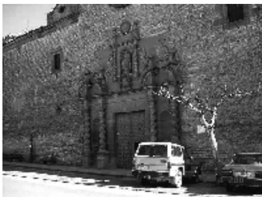
Façana de l'església de Sant Ramon

El matí es passava veient passar els "Tres Tombs" oficials del poble, reunint-se les famílies provinents de