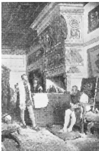
El rei Carles amb Pizarro

[aquella terra] la tenia Déu guardada per a l'Emperador»". 60